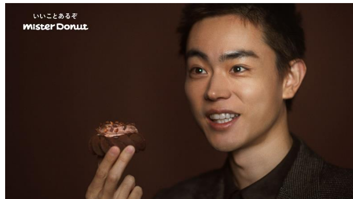
<ミスタードーナツ新 TVCM「いくつかの食感？」篇より>

「ヨロイツカ式ガトーショコラドーナツ」では「トリオレショコラ」や「ノドココ」など4種が登場します。それにともない、俳優の菅田将暉さんが出演する新 TVCM 「いくつかの食感？」篇（15秒）を同日から全国で放映開始します。