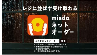
菅田さん OFF) ネットオーダーでも どうぞ。