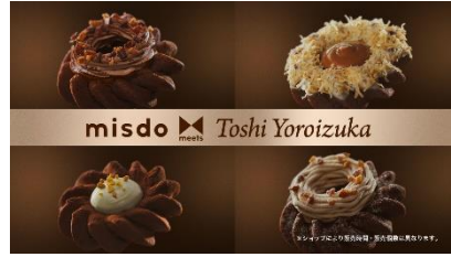
NA) ミスドミーツ トシ ヨロイツカ