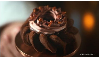
ガトーショコラ ドーナツに