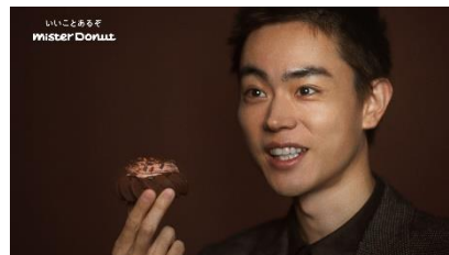
菅田さん) これが ヨロイツカ式。