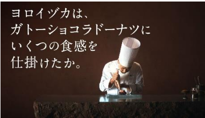
いくつかの食感を 仕掛けたか。