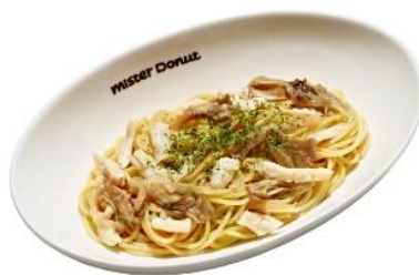
チキンと舞茸のペペロンチーノ (680円)

チキンと舞茸を具材に、にんにくと唐辛子で味付けした辛みと香りが引き立ったパスタです。