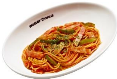
濃厚なナポリタン (680円)

トマトソースとデミグラスソースで濃厚に仕上げたナポリタンソースがポイントの定番パスタ。具材として、ベーコンとピーマンが入っています。