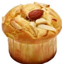
キャラメルアーモンド (216円)

アーモンドミルクを練り込んだしっとりとした生地の中に、生キャラメル味のクリームが入っています。仕上げにアーモンドをトッピングしました。