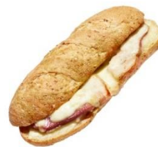
ホットサンド チーズとベーコン (410円)

全粒粉入りのパンに、ベーコンとチーズ、ホワイトソースをサンドし、焼き上げました。