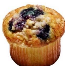
ブルーベリーチーズ (216円)

ヨーグルトを練り込んだしっとりとした生地の中に、チーズフィリングが入っています。仕上げにブルーベリーをトッピングしました。