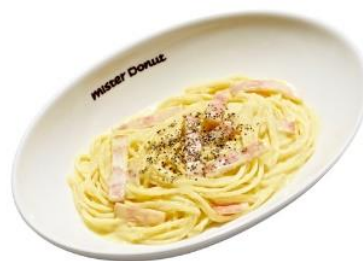
4種チーズのカルボナーラ (734円)

4種類のチーズ（チェダーチーズ、クリームチーズ、マスカルポーネチーズ、カマンベールチーズ）と卵黄が絡んだ、コク深いパスタです。