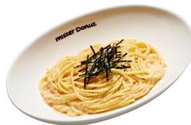
和風たらこクリーム (734円)

たらこクリームを和風だしで仕上げた、まろやかでやさしい味わいが特徴のパスタです。