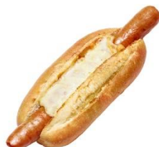
とろとろチーズドッグ (388円)

ジューシーなあらびきソーセージにとろりとしたチーズをトッピングし、濃厚な味わいに仕上げました。