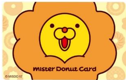
ミスタードーナツカード (ポン・デ・ライオン限定デザイン)

※ポン・デ・ライオン限定デザインは、レギュラーデザイン同様に購入可能。（ショップ在庫がなくなり次第、販売終了）