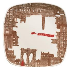
オリジナルプレート