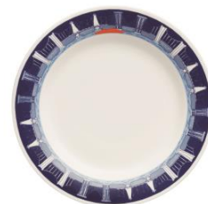
オリジナルプレート