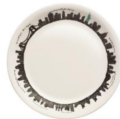
オリジナルプレート