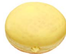
バナナホイップ (147円)

イースト生地のドーナツに、バナナホイップをつめ、バナナ風味のチョコでコーティングしました。