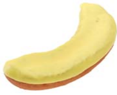
バナナファッション (126円)

バナナ型のオールドファッション生地を、バナナ風味のチョコでコーティングしました。