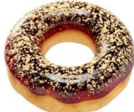
ぷるるんポン・デ・リング 黒みつ

もちもち食感のポン・デ・リング生地の上に、香り豊かな黒みつわらびもちをのせ、黒須きなこをトッピングしました。