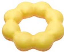
ポン・デ・バナナ (136円)

フレンチクーラー生地にはバナナホイップをはさみ、バナナ風味のチョコでコーティングしました。