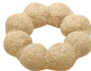
ポン・デ・リング生 抹茶黒糖

香り豊かな抹茶を練り込んだとてもやわらかくもちもちした生地には、黒五黒糖をまぶしました。