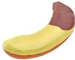
チョコバナナファッション (136円)

バナナ型のオールドファッション生地を、チョコレートとバナナ風味のチョコでコーティングしました。