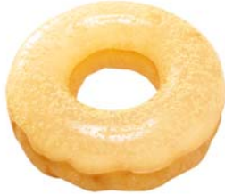
ぷるるんポン・デ・リング わらびもち

もちもち食感のポン・デ・リング生地の上に、塩味をほんのり効かせたわらびもちをのせ、黒須きなこをトッピングしました。