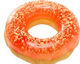
ぷるるんポン・デ・リング 桃

もちもち食感のポン・デ・リング生地の上に、甘い桃味のわらびもちをのせ、黒須きなこをトッピングしました。