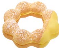
ポン・デ・バナナホイップ (147円)

ポン・デ・リング生地にはバナナホイップをはさみ、バナナ風味のチョコでコーティングしました。