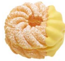
バナナホイップフレンチ (147円)

フレンチクーラー生地にはバナナホイップをはさみ、バナナ風味のチョコでコーティングしました。